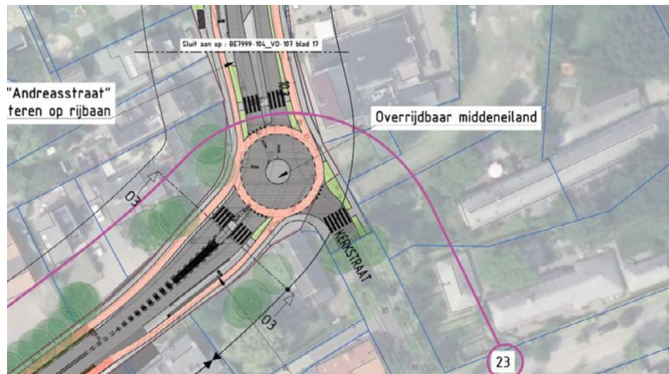
Rotonde N395 – Kerkstraat in Oostelbeers

In de drie kernen Oostelbeers, Middelbeers en Diessen heeft de Provincie per kern twee inloopavonden georganiseerd. Op deze avonden heeft de Provincie veel informatie en initiatieven opgehaald. Hiermee is het ontwerp verbeterd en sluit dit nu beter aan op de behoeften van de weggebruikers en omwonenden. In de kern Oostelbeers wordt bijvoorbeeld gedacht aan het toepassen van een minirotonde met zebrapaden, waardoor het oprijden van de N395 vanuit de Kerkstraat makkelijker en het oversteken van de N395 voor fietsers en voetgangers veiliger wordt.